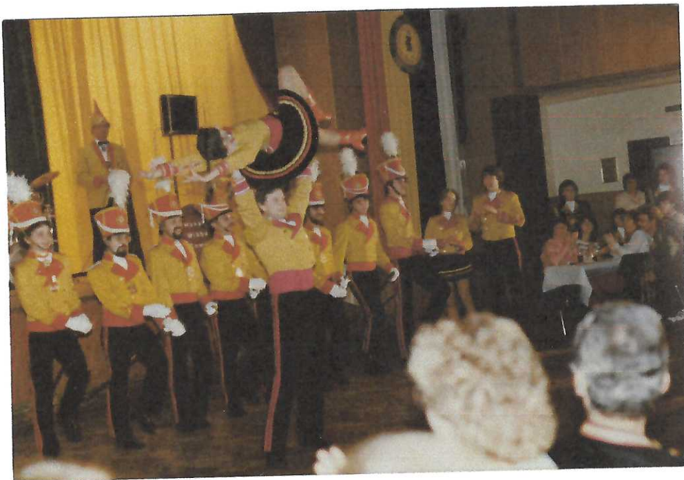
Prinzenbegräbnis Session 1984/85